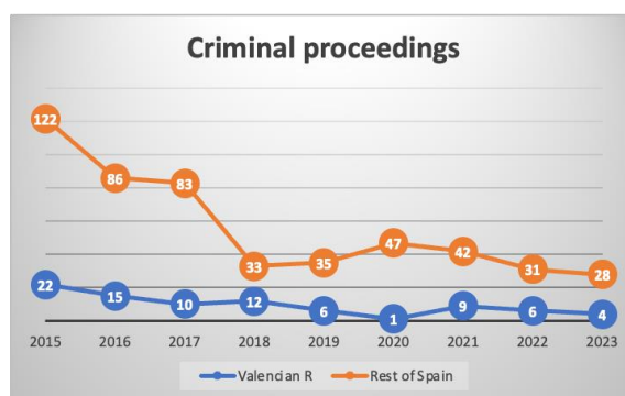
Figura 3. Procedimientos penales por corrupción en la Comunidad Valenciana y en el resto de España. Los datos de 2015 son una proyección anual debido a la falta de información sobre el primer semestre del año.

Siguiendo el itinerario marcado por nuestras hipótesis, comprobaremos en primer lugar si los casos de corrupción se han reducido en Valencia. Para ello, analizamos los datos de la base de datos del Consejo General del Poder Judicial (CGPJ) sobre los casos de corrupción abiertos en la Comunidad Valenciana que llegaron a juicio entre 2015 y 2023. Después, los comparamos con los datos del resto de España (ver Gráfico 3). Según nuestra hipótesis, lo normal sería que tras el efecto retardo, a partir del tercer año tras la llegada del nuevo gobierno y la puesta en marcha de las leyes, se produjera una reducción significativa del número de casos e imputados en la Comunidad Valenciana.