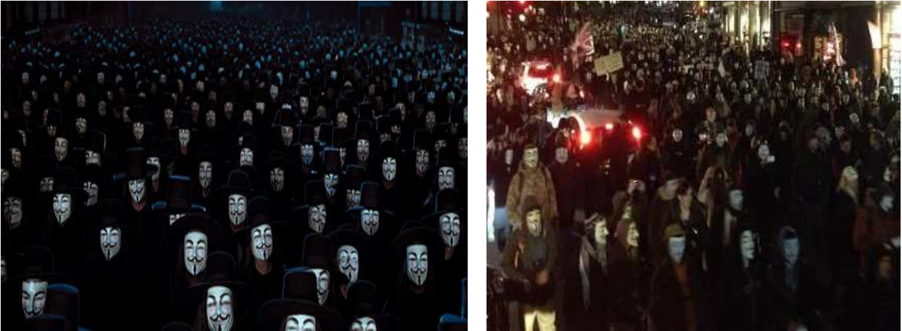
Imágenes vinculadas a V de Vendetta : a la izquierda secuencia final del filme, a la derecha marcha hacia el parlamento de Londres encabezada por los miembros de Anonymous (5 Nov. 2012)

las calles con máscaras de Guy Fawks, poderosa imagen de la masa unida antisistema que se ha convertido, en la realidad, en símbolo de múltiples protestas de los últimos años asociadas a grupos activistas como Anonymous.