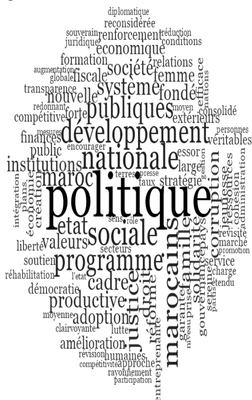
Figura 1. Nube de palabras PJD 2011

A continuación se muestra una nube de palabras que contiene las 100 palabras con contenido más repetidas en el programa político del PJD en 2011. El tamaño de las palabras indica la intensidad de la frecuencia de aparición. La nube resultante muestra la primacía de lo político (palabra más repetida), de lo social y del desarrollo, y de la dimensión nacional. Tal y como afirman las hipótesis más repetidas, “[e]l lenguaje político ha tendido a eclipsar a la retórica religiosa en unos programas electorales que [ponen] el énfasis en la lucha contra el autoritarismo, la corrupción y la mejora de la situación económica.” (Hernando de Larramendi, 2013: 73).